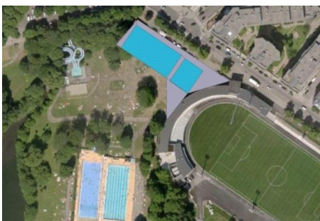
Svømmehall ved inngangspartiet?

Du kan melde deg på, og du finner også mer informasjon på http://www.frognersvømmeklubb.no/