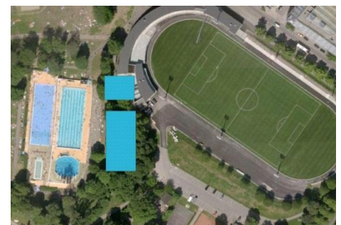
Eller som grottebad under gratishaugen?